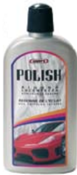
POLISH CERA AUTO

RINNOVA LA VERNICE DELL'AUTO E DELLA MOTO SIA CHE SIANO METALLIZZATE O MENO. LASCIA UN VELO PROTETTIVO CONTRO L'UMIDITÀ, I RAGGI UV E GLI AGENTI ATMOSFERICI. RIDONA BRILLANTEZZA ANCHE ALLE VERNICI PIÙ OPACHE. RESISTE A SVARIATI LAVAGGI